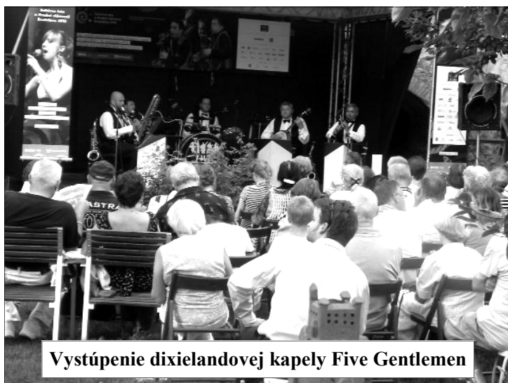
Vystúpenie dixielandovej kapely Five Gentlemen

Cyklus „Pramene“ predstavuje a prezentuje tvorbu literárnych klubov z celého Slovenska. Počas leta mali návštevníci možnosť byť „Na krok od raja“ pri prezentácii literárneho klubu zo Spišskej Novej Vsi, mohli si naplánovať „Rendez-vous U červeného raka“ s autormi z literárneho klubu z Bardejova, niektorí si možno aj našli „Čas na dobrú čítačku II.“ s bratislavským literárnym klubom Generácia, prišli si pozrieť a vypočuť aj „Littrenie“ literárneho klubu z Trnavy.