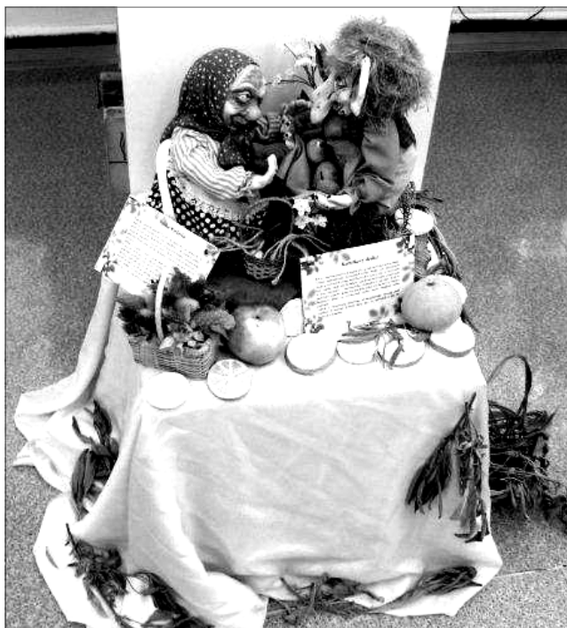
Babka Kysľavka a Kamilkový dedko

ná, s obrovským úspechom sa stretla v Čechách a momentálne putuje po Slovensku. S priaznivým ohlasom sa stretla v bratislavských knižniciach, v Knižnici Bratislava - Nové Mesto, Miestnej knižnici Petržal-