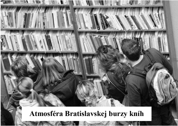
Atmosféra Bratislavskej burzy kníh

5 000 € je určený na rozvoj služieb a nákup zvukových kníh pre Oddelenie nevidiacich a slabozrakých Mestskej knižnice.