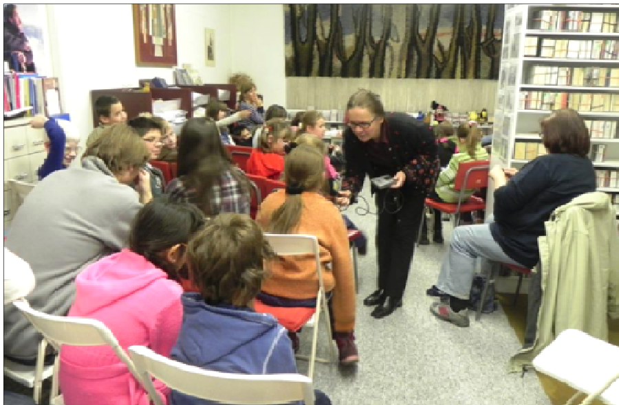
Čítajme spolu – rozhovory s deťmi o podujatí pre vysielanie Slovenského rozhlasu

Za projekt Čítajme spolu udelila Správna rada účtu Slovensko bez bariér a porota nezávislých odborníkov 7. decembra 2015 vo VIII. etape súťaže Samospráva a Slovensko bez bariér 2014 - 2015 Oddeleniu pre nevidiacich a slabozrakých Mestskej knižnici v Bratislave ocenenie v kategórii „Pamäťové a kultúrne inštitúcie a vzdelávacie aktivity“.