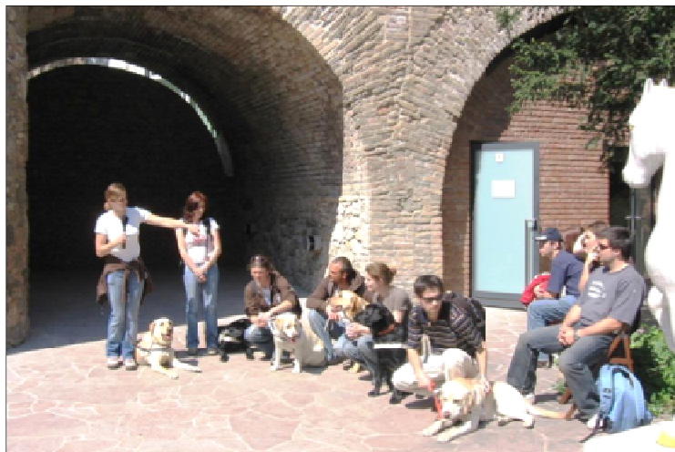
Ukážka výcviku vodiacich psov v letnej čítárni U červeného raka

Ukážka výcviku vodiacich psov – sa každoročne koná v letnej čítárni U červeného raka na Michalskej 26 pri príležitosti dní otvorených dverí bratislavskej samosprávy Bratislava pre všetkých (apríl).