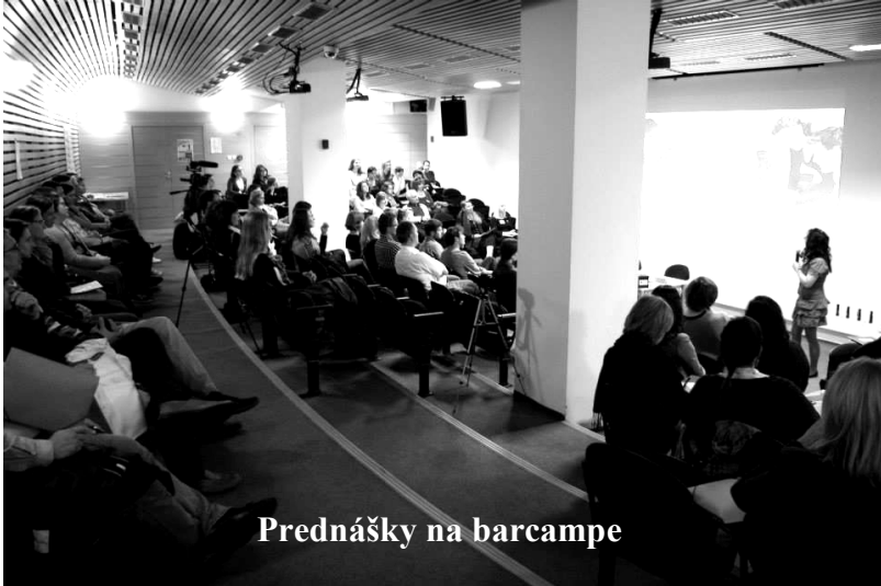
Prednášky na barcampe

myšlienku, projekt, aktivitu – si príspevok jednoducho prihlási do programu. Konferenčný výbor nerozhoduje o tom, čo prijať - neprijať, vítané sú všetky príspevky účastníkov. Celé podujatie je bezplatné, takže jedinou investíciou účastníka je čas, ktorý sa rozhodne venovať práve tomuto podujatiu.