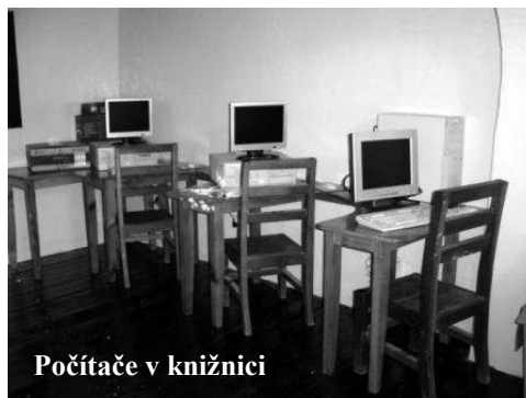
Počítače v knižnici