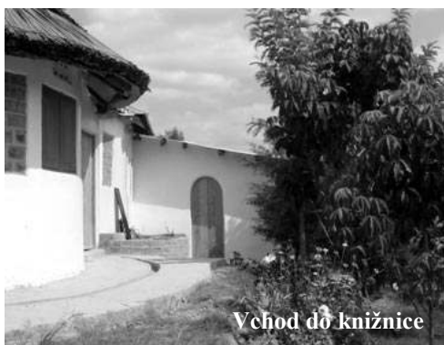
Vchod do knižnice

http://www.susnow.org/afrika/ (Katkin rozsiahlejší popis pozadia projektu a zážitkov – v slovenčine)